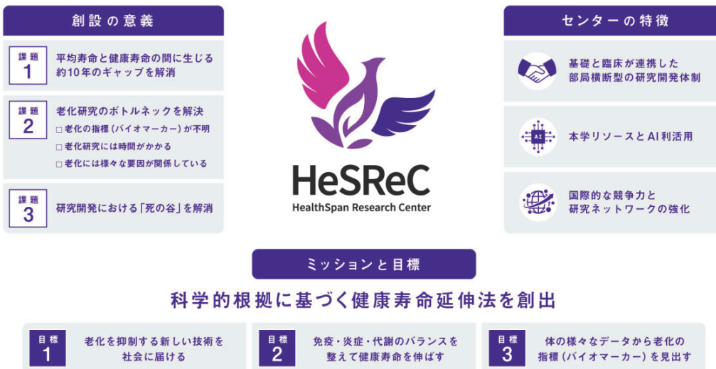
図 1. HeSReC の概要